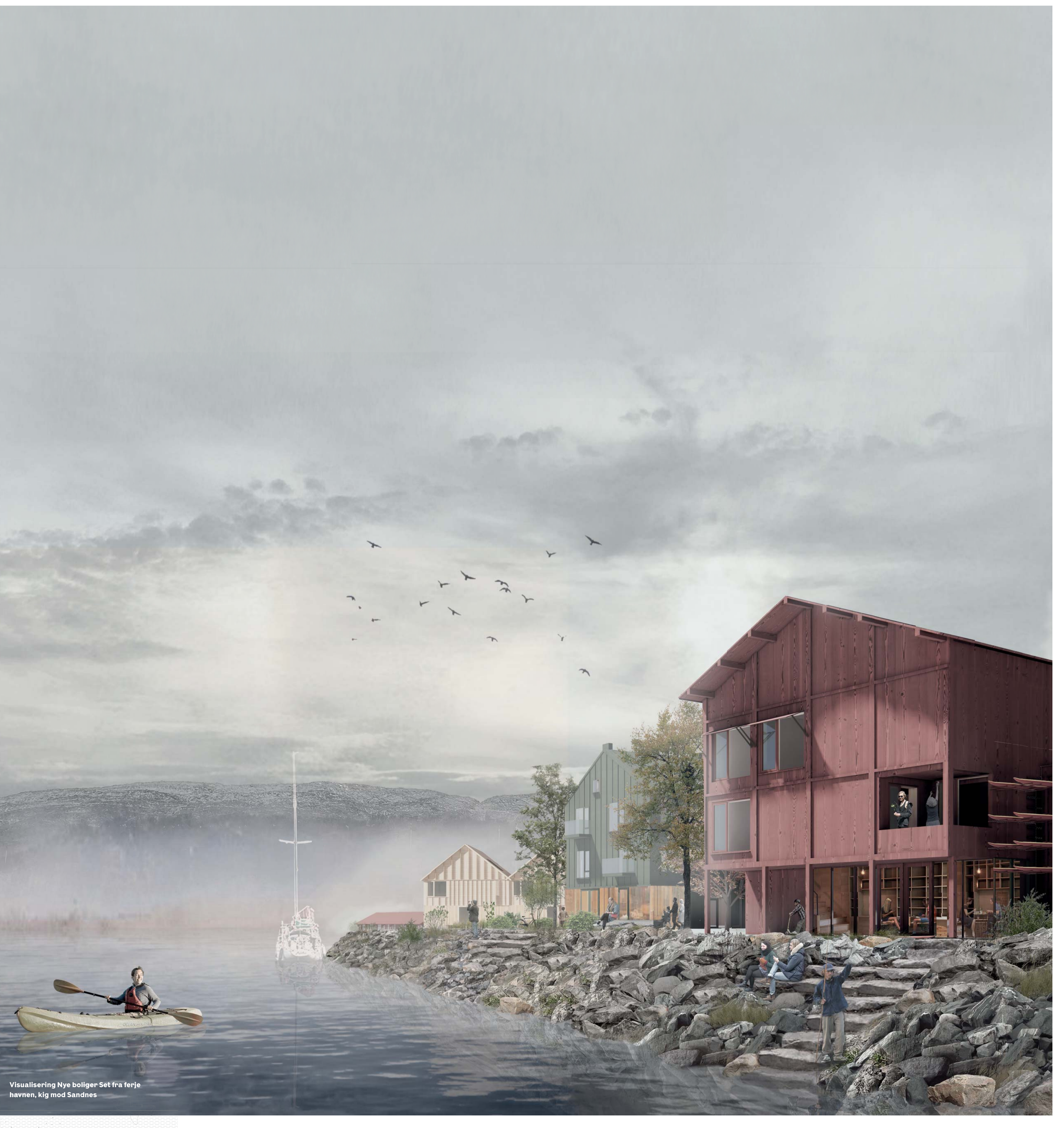
Visualisering Nye boliger Set fra ferje hænen, kig mod Sandness