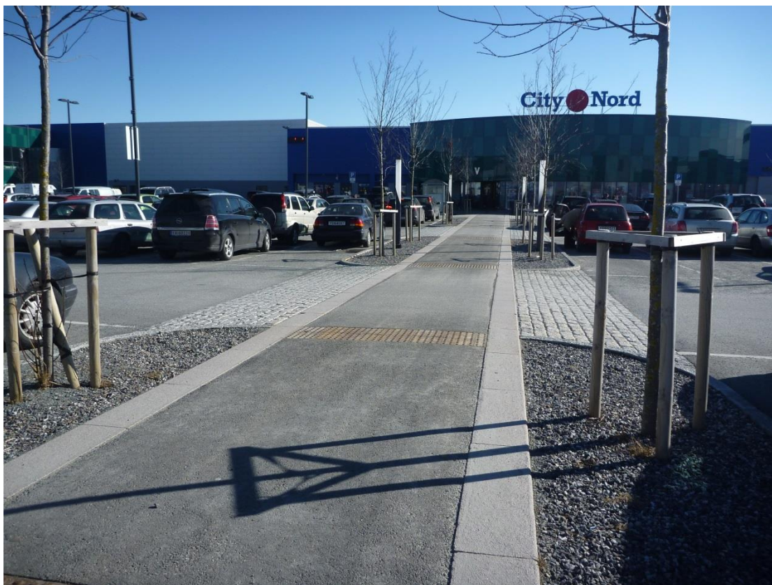
Illustrasjon: Eksempel på fotgjengervennlig løsning parkeringsplass.

Planen skal tas opp til evaluering og revisjon midt i planperioden, i tillegg til ved utgangen av planperioden. Administrasjonen skal da presentere en evaluering av trafikksikkerhetsplanen og oppfølging av denne for kommunestyret.