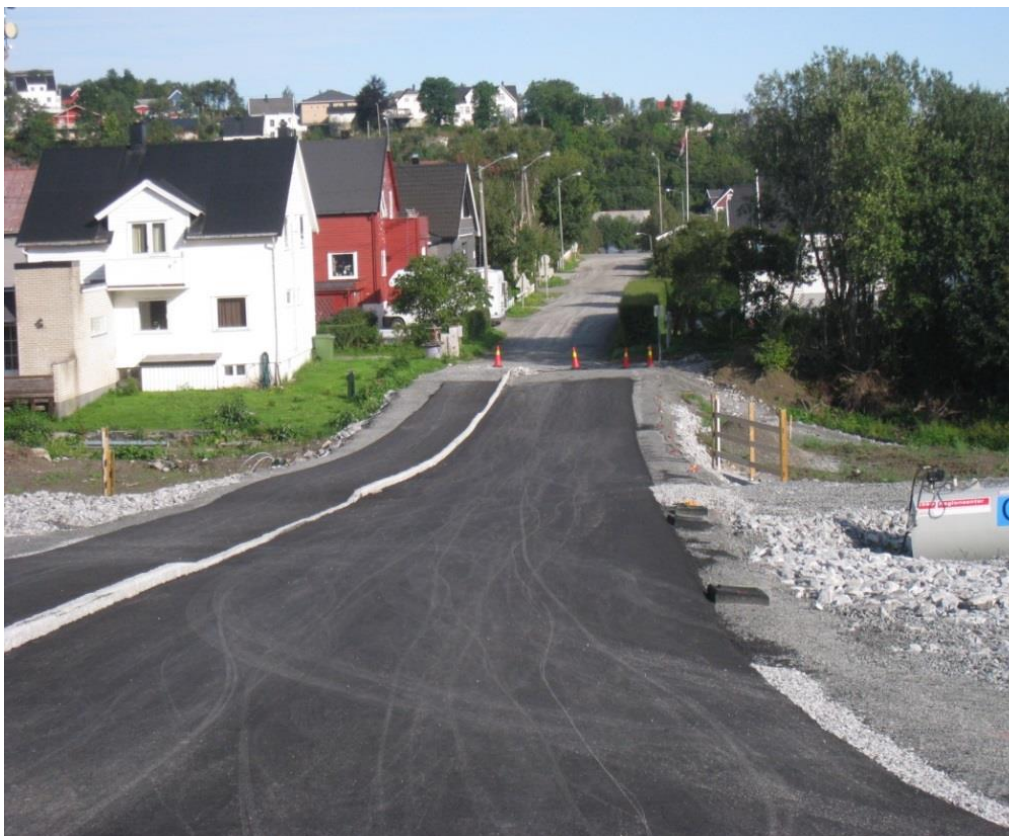
Illustrasjon: Arbeidet med etablering av fortau ved Sandnes skole er i gang.