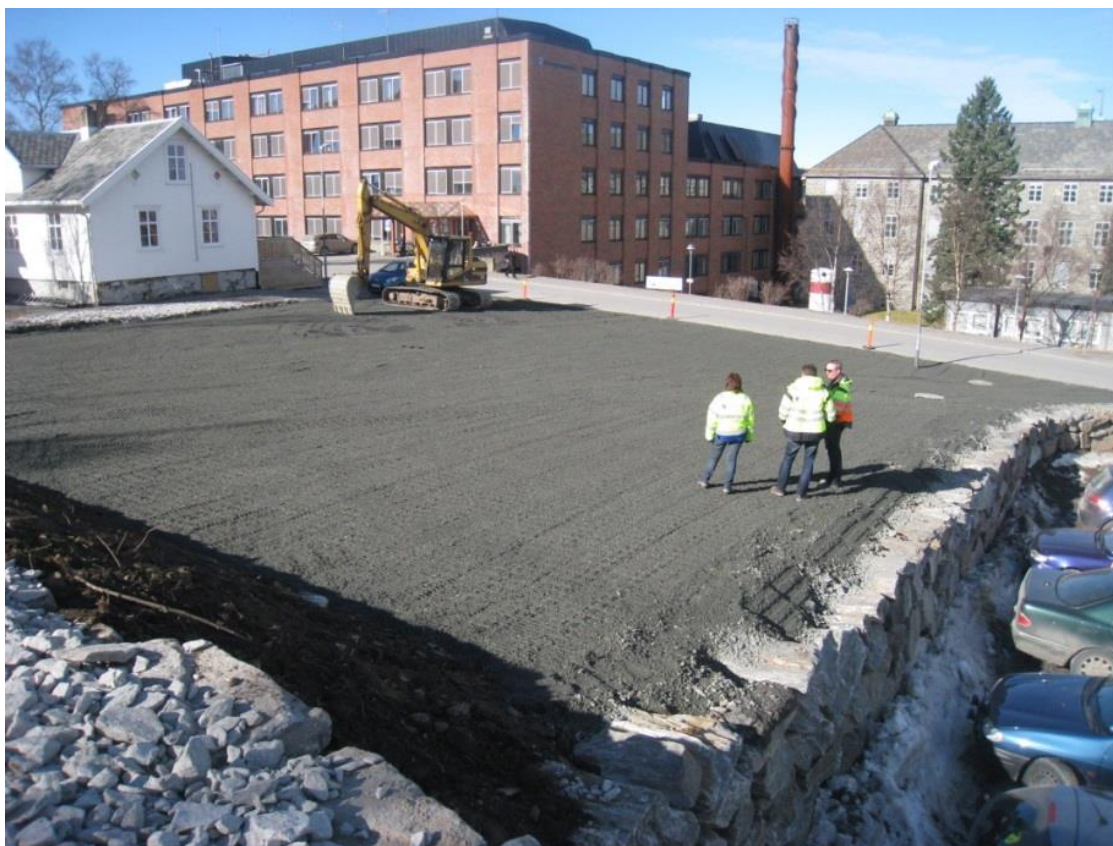
Illustrasjon: Stopp- og snuplass for buss ved sykehuset under arbeid.

I tillegg til tiltakene som er beskrevet i påfølgende tabell, er det også behov for en rekke oppgaver knyttet til drift og vedlikehold. Dette omfatter for eksempel arbeid med å fjerne, eventuelt erstatte, hindringer med rumlefelt, fjerne avvisende kanter og for høye kantstein i gatekryss eller å etablere påkjøringsvennlige bommer. Dette er arbeid i mindre omfang, og som bør tas fortløpende i tilknytning til annet drift og vedlikeholdsarbeid. Brøyting og vintervedlikehold av fortau og sykkelveier må også tillegges større prioritet. Dette er arbeid som ikke tas med i trafikksikkerhetsplanen, da det er en del av kommunens kontinuerlige drift.